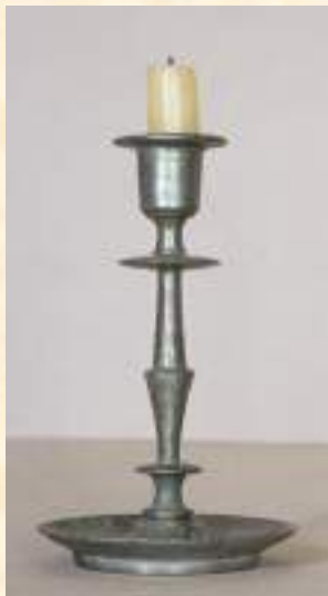
Подсвечник, XIX в.

Была продолжена работа по комплектованию коллекции детской одежды XIX - XX вв.. Приобретенные у коллекционера крестьянское платье из натурального шелка, нижняя юбка и сорочка из тончайшего батиста, украшенные изящным кружевом, летнее репсовое пальто и ми-