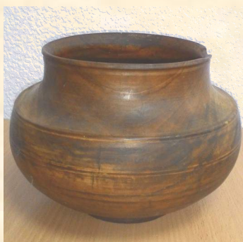
Братина, нач. XX в.