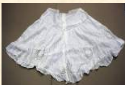
Нижняя юбка, конец XIX—нач. XX вв.