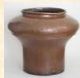
Медник (после реставрации)