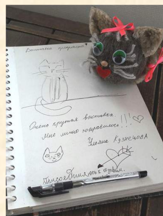
Отзывы о «Детской субботе»

За 2016 год было проведено 1580 экскурсий, 15 массовых мероприятий