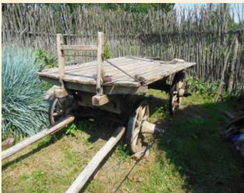
Телега, конец XIX – нач. XX вв.