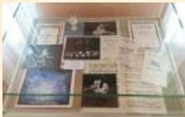
«Вот билет на балет»