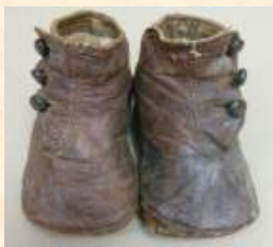
Детские ботиночки, конец XIX в.