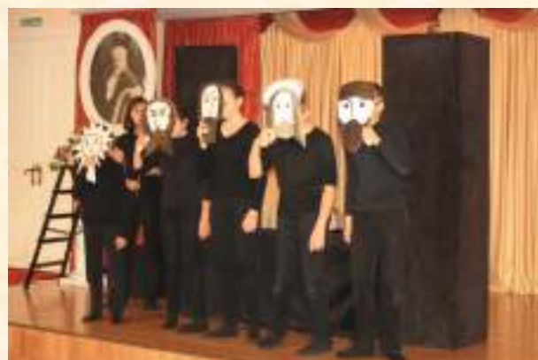
День солидарности в борьбе с терроризмом