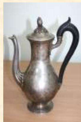
Кофейник. XIX век