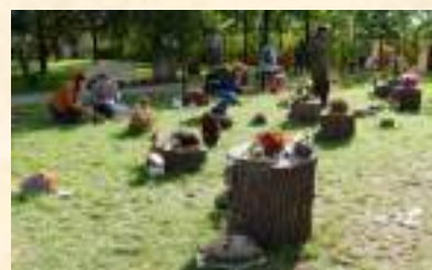
«Если не ёж, то кто ж?»