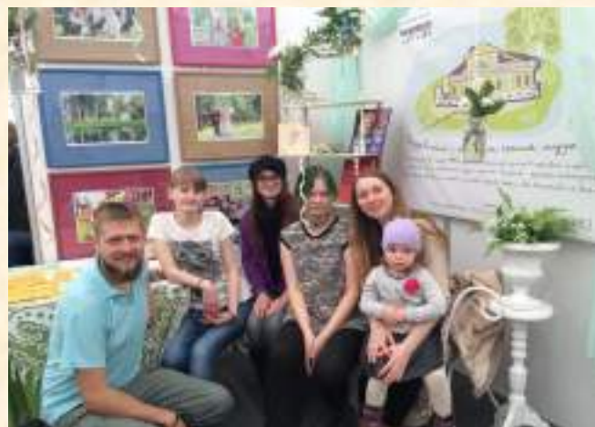
«Музей приглашает в лето» (Выставка «Спорт. Туризм. Отдых», г. Ижевск)