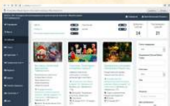
Профиль музея в системе «Единая поисковая информационная система в сфере культуры»

В 2016 году на официальном сайте музея-усадьбы П.И. Чайковского было опубликовано более 100 заметок, фотоотчетов, объявлений. Был дополнен раздел «Исследователям» информацией о более чем 200 единиц фондового хранения. На официальном сайте и в социальных группах музея ежедневно публиковалась актуальная информация, афиши и фотографии, заполнялись