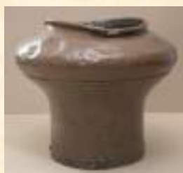
Медник, конец XIX в. (до реставрации)