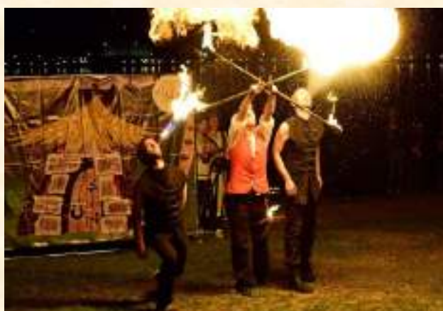
«Ночь музеев «