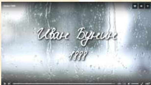
Видеоролик для конкурса «Читаем Бунина»