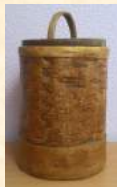
Туес, конец XIX – нач. XX вв.