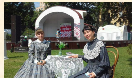
«Гербер» в г. Москва

ся спектакль «Персеполис» театра «Птица» (режиссер С. Шанская, г. Ижевск). Вслед за спектаклем, начался открытый урок «Вместе за безопасность». Специалисты Управления Федеральной противопожарной службы №80 МЧС России рассказали о всех тонкостях своей службы. Были продемонстрированы пожарные машины, спецодежда и средства тушения пожаров.