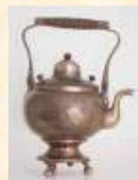
Сбитенник (после реставрации)