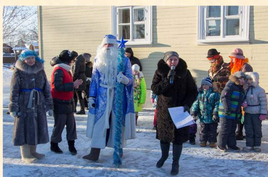
«Вместе водим хоровод»