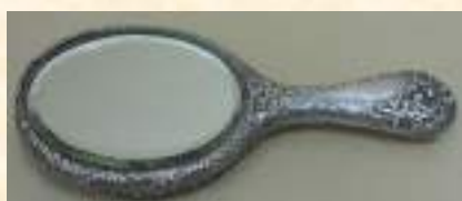
Зеркало, XIX в.