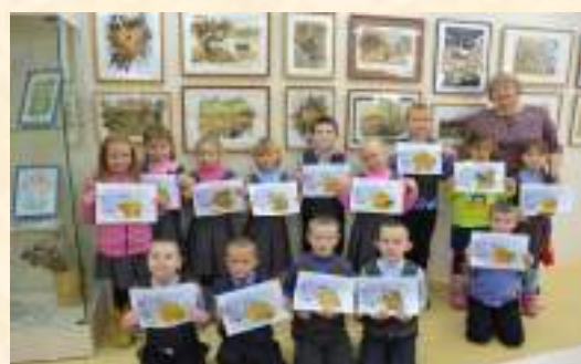
«Шелест осенних красок»