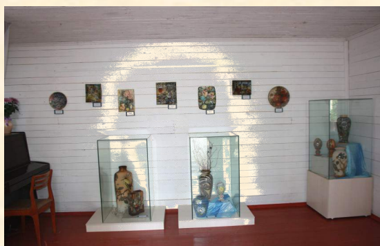
«Мечты о прошлом»