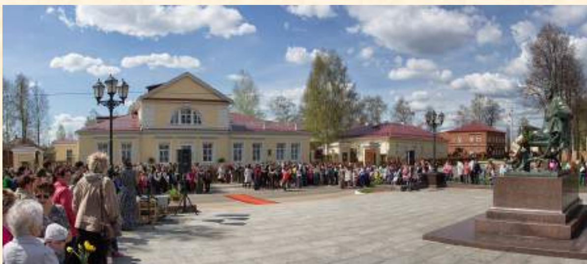
«День рождения П.И. Чайковского»