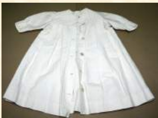
Детское летнее пальто, нач. XX в.

Хорошим дополнением музейного собрания посуды XIX века стал кофейник изготовленный на одном из самых знаменитых заводов столовых приборов "Christofle", Франция.