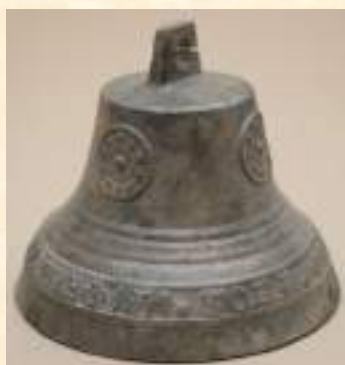
Колокольчик, XIX век