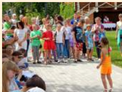
«Мелодии лета— 2016»