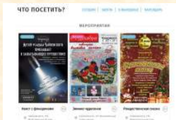
Профиль музея на портале «МасМер»