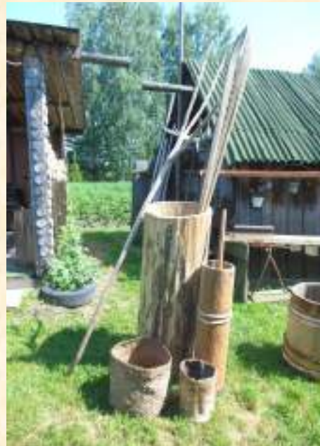
Предметы быта, конец XIX – нач. XX