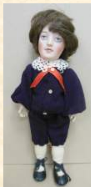
Кукла, нач. XX век