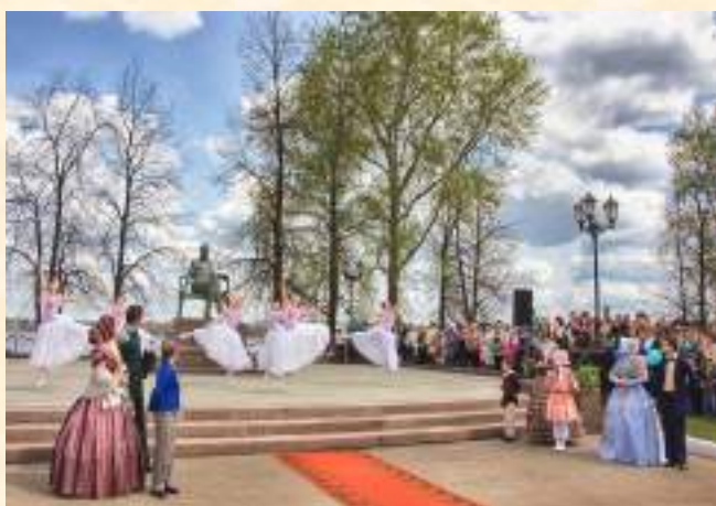
«День рождения П.И. Чайковского»