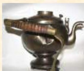
Сбитенник, XIX в. (до реставрации)

В 2016 году было отреставрировано 11 музейных предметов для экспозиции «Людская изба» и «Изба садовника» на сумму 80 000 рублей: сбитенник, пышечницы, медник, кастрюля медная, рукомойник, чугунок и др.