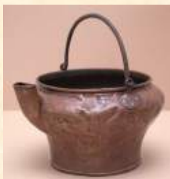
Подойник, конец XIX – нач. XX вв.