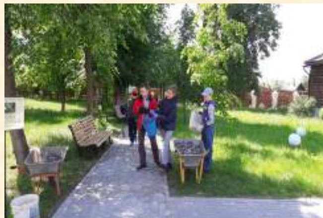
Доброхоты в музее