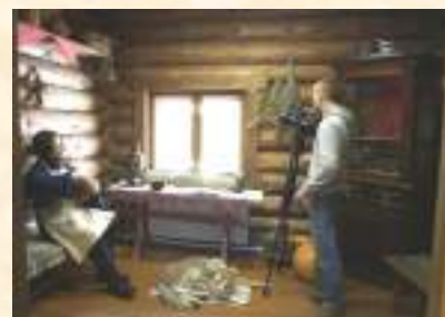
Съемки новой экспозиции для программы «Госпожа у дачи» ТРК «Моя Удмуртия»

В течение года велась активная работа в автоматизированной информационной системе «Единое информационное пространство в сфере культуры» и портале Министерства культуры и туризма УР «Масмер».