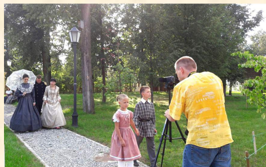
Съемки фильма для французского телевидения совместно с кафедрой иностранных языков УдГУ