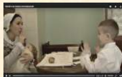
Видеоролик для конкурса «Диво России»