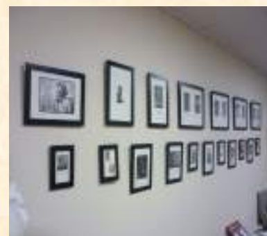
«Тихая мелодия графики»

В 2016 году в музее было организовано 39 выставок, 10 выставок прошли вне музея.