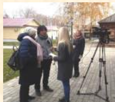
Директор 5 канала японского телевидения дает интервью ТК «ВТВ» о съемках в музее