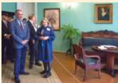
В.А. Гергиев на экскурсии в музее

7 мая состоялось торжественное празднование 176-летия со дня рождения П.И. Чайковского. У памятника композитору прошло театрализованное представление. Жители и гости г. Воткинска побывали на экскурсии «Петр Чайковский. Годы детства». На территории усадьбы были организованы развлекательные меро-