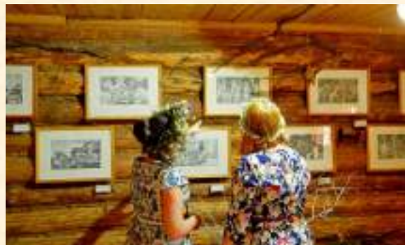
«Деревенское детство мое»