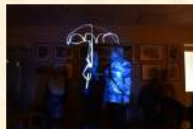
Мастер-класс по фризлайту