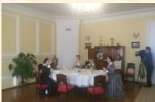
Театрализованное представление для программы ТК «НТВ» «Поедем! Поедим!»