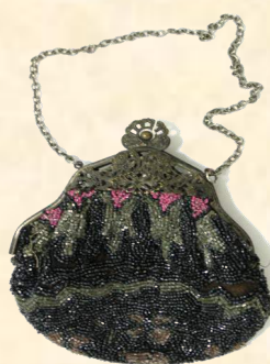
Редикюль, обшитый бисером, нач. XX в.