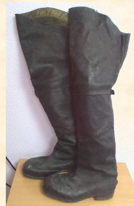
Сапоги мужские, XIX век