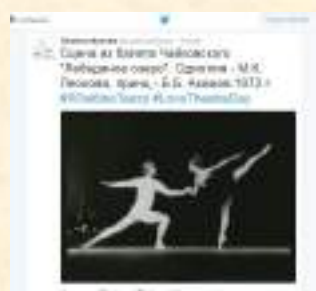
Страница музея в «Twitter», участие в международной интернет-акции #ЯЛюблюТеатр

Успешной была совместная работа с компанией «МТС» по созданию и запуску историко-культурного проекта «Мобильный гид». Это интернет-сервис, используя который, посетители, с помощью смартфонов и планшетов, могут прослушать аудиоэкскурсию по территории музейного комплекса. Проект был запущен 18 мая в День музеев.