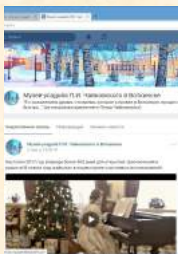
Группа музея в социальной сети «ВКонтакте»