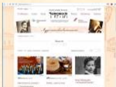
Официальный сайт музея