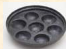
Пышечница (после реставрации)