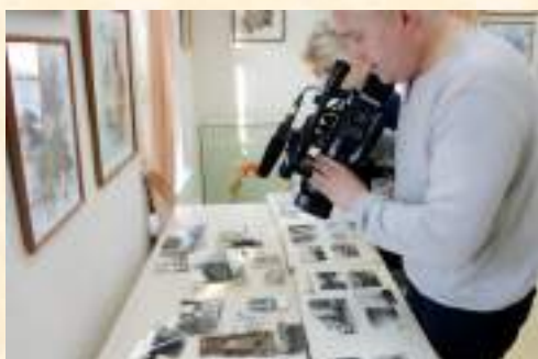
Съемки сюжета ТК «ВТВ» об акции по сбору старинных фотографий