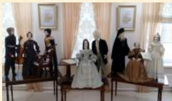
«Вы поедете на бал?»