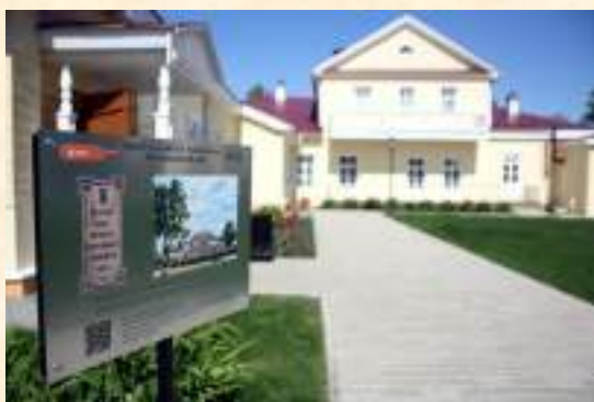
«Мобильный гид» на территории музея-усадьбы