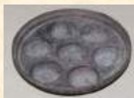
Пышечница, конец XIX в. (до реставрации)