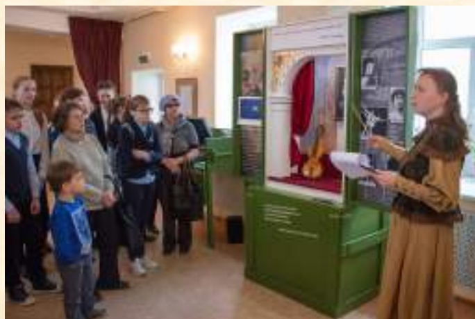
«Музыка Чайковского – музыка Победы»